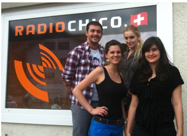
Das neue RadioChico Team in Goldbach